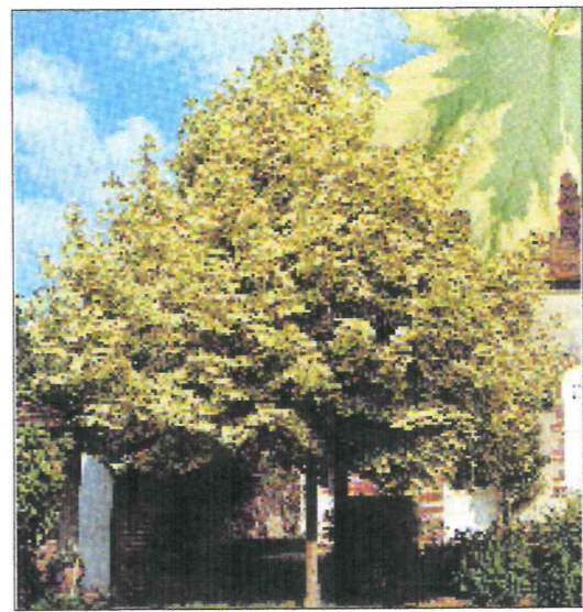
Acer Platanoidis - h. 400 - 450